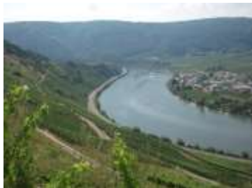
父なるライン、母なる モーゼル

7月31日から8月7日まで3年ぶりに実施しました。モーゼル地域とルクセンブルクにも足を伸ばしました。これから毎号参加者に投稿してもらいますので、詳細はそちらに譲って、写真で雰囲気をお伝えしましょう。