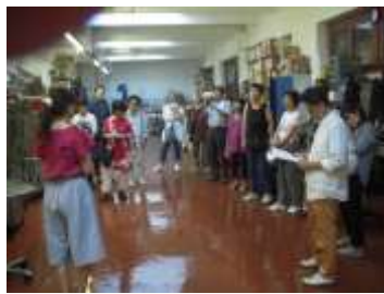
SMW 社の蔵見学での説明