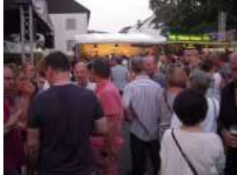
トリアーのワイン祭り