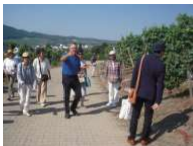
ワイン畑でぶどう栽培の説明