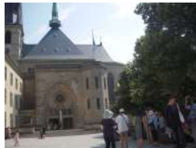
ルクセンブルク大聖堂前