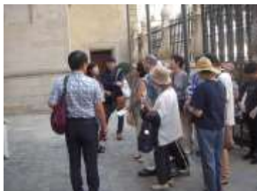
サビエルの顕彰碑の前に